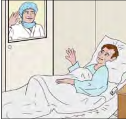
ท่านสามารถขอพนักงานสาธารณสุขให้แสดงใบหน้าก่อนเข้ามาในห้องของท่านได้

เป็นเรื่องลำบากเวลาที่ท่านมองเห็นหน้าของคนที่กำลังรักษาท่านอยู่ได้ไม่เต็มใบหน้า อาจเป็นเรื่องยากที่จะจดจำว่ามีใครบ้างที่กำลังทำงานอยู่ในแผนกกักกันพิเศษ และมีผู้ป่วยหลายรายรู้สึกว่าการติดต่อสื่อสารนั้นดูห่างไกลและเยือกเย็นมากเวลาคนสวมหน้ากาก อย่างไรก็ตาม ท่านสามารถถามชื่อของคนที่กำลังรักษาท่านได้ และท่านสามารถขอให้เขาเปิดหน้าต่างผ่านช่องกระจกที่ประตูก่อนจะเข้ามาในห้องของท่าน — เพื่อที่ท่านจะได้รู้สึกว่าคุณรู้จักพวกเขาดี ยิ่งกว่าเดิม