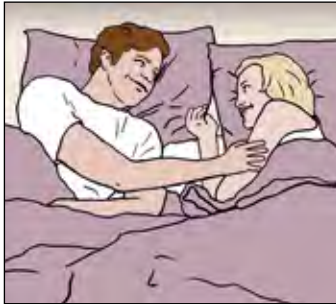
การมีเพศสัมพันธ์กับคู่ของคุณจะเป็นผลดีต่อคุณทั้งคู่

เวลาที่เข้ารับการรักษาวัณโรคนั้น ไม่มีเหตุผลทางการแพทย์ใดที่บอกว่าห้ามร่วมเพศ การมีเพศสัมพันธ์กับคู่ของคุณจะทำให้คุณทั้งสองรู้สึกดีและมองโลกในแง่บวก เช่นเดียวกับที่ผู้ป่วยคนหนึ่งว่าไว้ “เพศสัมพันธ์ทำให้หัวใจผมสงบสุขและลดความตึงเครียด” การได้อยู่ใกล้ชิดกับคู่ของคุณเป็นเรื่องสำคัญต่อการฟื้นตัวจากโรคนี้