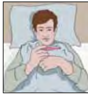
เป็นไข้ช่วงระยะเวลา หนึ่ง