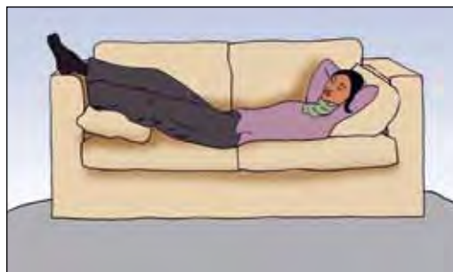
ผู้ป่วยสามารถดูแลตนเองได้ด้วย การพักผ่อนให้เพียงพอ

ผู้ป่วยวัณโรคควรได้รับเวลาเพื่อพักผ่อนมากเท่าที่ผู้ป่วยรู้สึกที่ร่างกายตนเองต้องการ นี่เป็นเรื่องสำคัญมากโดยเฉพาะช่วงสองเดือนแรกของการรักษา