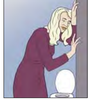
คลื่นไส้และอาเจียน

หากท่านรำคาญใจเพราะอาการคลื่นไส้รุนแรง ท่านก็อาจทานยาแก้อาการคลื่นไส้ได้