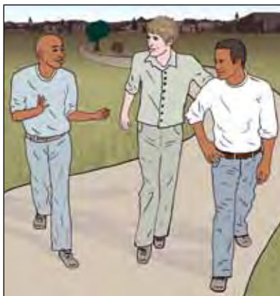
เป็นเรื่องดีที่จะเข้าสังคมและทำตัวให้กระฉับกระเฉง

ด้วยการใช้กิจกรรมกลุ่ม ทาง LHL จะจัดกิจกรรมและการพบปะทางสังคมสำหรับผู้ป่วย ปกติแล้วกิจกรรมนี้จะไม่แพงมากนัก นอกจากนี้ ท่านสามารถติดต่อกับหน่วยงานชุมชนในละแวกบ้านท่าน หรือองค์กรต่างๆอย่างเช่นกาชาดหรือ Frivillighetscentralen แล้วถามว่าพวกเขาให้บริการช่วยเหลืออะไรบ้าง กรรณาดูบทที่ 4 ของคู่มือเล่มนี้เกี่ยวกับข้อมูลด้านสิทธิทางการเงิน