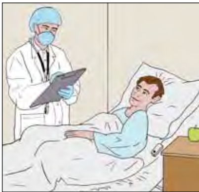
ผู้ที่ทำงานในแผนกกักบริเวณพิเศษจะสวมหน้ากาก

ในแผนกกักบริเวณพิเศษนี้ ทุกคนที่สัมผัสหรือติดต่อกับผู้ป่วยจะต้องสวมหน้ากาก หน้ากากนี้จะคลุมปากและจมูก รวมถึงป้องกันผู้สวมจากการติดเชื้อแบคทีเรียในอากาศ (แบคทีเรียอาจจะแพร่สู่อากาศได้เวลาผู้ป่วยพูดคุย ไอ หรือจาม)