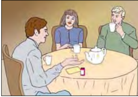
ผู้ป่วยที่เปิดเผยเกี่ยวกับโรคของตนมักจะได้รับประโยชน์มากมายจากความเปิดเผยนั้น

ถ้าคุณพบว่าเป็นเรื่องยากที่จะเปิดเผยเรื่องวัณโรคที่คุณเป็นอยู่ แต่คุณก็ตัดสินใจแล้วว่าไม่ว่าอย่างไรคุณก็จะพูดคุยเรื่องนี้ ก็อาจเป็นการดีที่จะวางแผนว่าจะทำเรื่องดังกล่าวเมื่อไร หากคุณรู้สึกอ่อนแอและเหนื่อย ก็อาจดีถ้าจะรอไปก่อน การทำสิ่งที่คุณหวาดหวั่นนั้นจำเป็นต้องใช้พลังงานมาก; ดังนั้น จึงอาจเป็นการดีที่ว่าจะรอจนกระทั่งคุณรู้สึกแข็งแรงขึ้นสักเล็กน้อย เมื่อคุณรู้สึกพร้อม ก็ให้เริ่มต้นเปิดเผยกับคนที่คุณวางใจหรือรู้สึกไว้วางใจกับคุณ สำหรับผู้ป่วยหลายคนแล้วแค่การบอกกับคนใกล้ชิดอย่างเช่นเพื่อนสนิทและญาติก็เพียงพอแล้ว