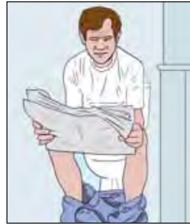
ผู้ป่วยบางคนก็มีปัญหาด้านการย่อยอาหารเวลาทานยารักษาวัดโรค

นอกจากจะฆ่าแบคทีเรีย TB แล้ว ยารักษาวัดโรค ยังส่งผลต่อแบคทีเรียในลำไส้ตามปกติอีกด้วย ด้วยเหตุนี้ ผู้ป่วยบางรายจึงประสบปัญหาในระบบย่อยอาหาร บางคนก็อุจจาระแข็ง บางคนก็อุจจาระเหลว