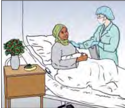
ผู้ป่วยเกือบทุกคนจะพักในโรงพยาบาลในช่วงแรกของการรักษา

สำหรับผู้ป่วยที่เราสงสัยว่ามีเชื้อวัณโรคที่สามารถติดต่อผู้อื่นได้ เราจะให้พักในแผนกกักบริเวณพิเศษ (isolert avdeling หรือ isolert rom) ของโรงพยาบาล