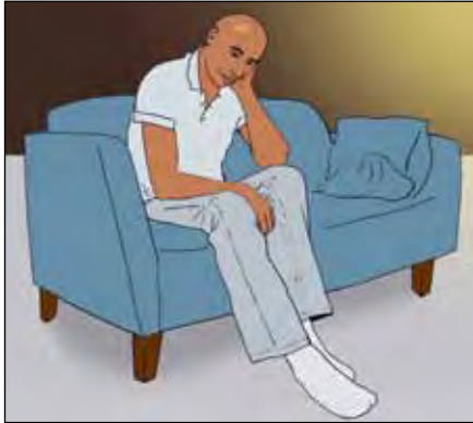
ผู้ป่วยบางคนก็มีช่วงที่รู้สึกโดดเดี่ยวและซึมเศร้า

ผู้ป่วยวัณโรคหลายคนบอกว่าตนเองรู้สึกโดดเดี่ยวและมีช่วงเวลาที่รู้สึกซึมเศร้า ผู้ป่วยรายหนึ่งกล่าวว่า: “ตอนที่ฉันทราบถึงความร้ายแรงของโรคนี้ ฉันเศร้ามาก ฉันหยุดพูดคุยกับผู้คน ถึงแม้จะเป็นทางโทรศัพท์ก็ตาม ฉันนั่งอยู่คนเดียวตามลำพัง”