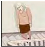
รู้สึกอ่อนเพลียและ เหนื่อยง่าย