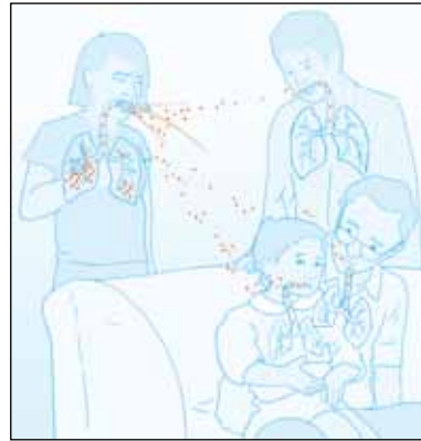
วัณโรคแพร่กระจายด้วยการหายใจเอาแบคทีเรียจากอากาศเข้าไป

ผู้ที่ติดเชื้อแบคทีเรียวัณโรคอาจจะไม่ป่วยก็ได้ คาดกันว่า 1 ใน 3 ของประชากรโลกมีแบคทีเรียวัณโรคอยู่ในร่างกาย แต่มีไม่กี่คนเท่านั้นที่ป่วยเป็นโรค สาเหตุที่ผู้ติดเชื้อบางรายแสดงอาการป่วยก็เพราะภูมิคุ้มกันที่ลดต่ำลง ภูมิคุ้มกันที่ลดลงนี้อาจมีสาเหตุมาจากโรคบางชนิด ความเครียด ความเปลี่ยนแปลงของอากาศ โภชนาการที่ไม่ดี หรือสาเหตุอื่น บางทีก็กินเวลาหลายปีหลังจากติดเชื้อแบคทีเรียวัณโรคแล้วจึงจะเกิดอาการเจ็บป่วยขึ้น