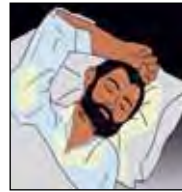
เหงื่อออกตอนกลางคืน