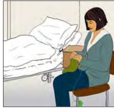
ลองคิดหาอะไรทำเวลาที่คุณอยู่ในแผนกกักบริเวณพิเศษ