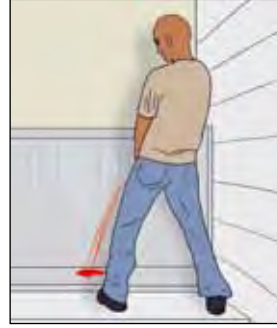
ปัสสาวะมีสีแดงเวลาที่ท่านทานยารักษาวัดโรค

ของเหลวทุกชนิดจากร่างกายอาจมีสีแดง ชมพู หรือส้มเวลาท่านทานยารักษาวัดโรค นี่ไม่ใช่เรื่องอันตราย สาเหตุที่เป็นเช่นนี้ก็คือยารักษาวัดโรคประกอบด้วยสารสีแดง