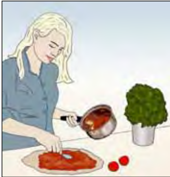
งานนี้อาจจะพอดี...

เมื่อคุณรู้สึกแข็งแรงพอแล้ว คุณก็สามารถกลับไปทำงานหรือกิจกรรมประจำวันอย่างอื่นของคุณได้ ลองทำสิ่งต่างๆเพื่อดูว่าคุณทำอะไรได้แล้วบ้าง ควรระวังในช่วงเริ่มต้นและเริ่มด้วยงานเบาๆมาก่อน เช่นงานสำนักงานหรืองานบ้านเบาๆ ผู้ป่วยบางคนรู้สึกว่าพวกเขาต้องเริ่มต้นทำงานอีกครั้งทันทีที่มีแรงแม้เพียงเล็กน้อย แต่ร่างกายคุณต้องการการพักฟื้นเพื่อฟื้นฟู เป็นเรื่องสำคัญที่คุณต้องฟังร่างกายคุณ — อย่างผืนสังขารจนเกินไป และจำไว้ว่าการทำงานบ้านและการอุ้มเด็กก็ถือเป็นงานเช่นกัน!