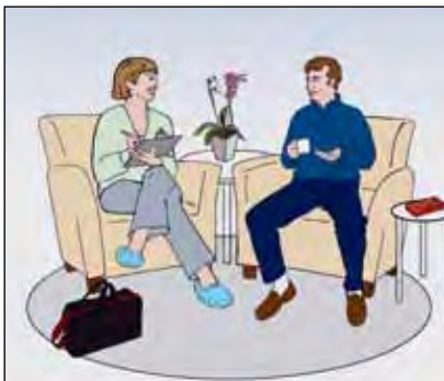
ผู้ป่วยหลายคนต้องการให้เราไปส่งยาให้ที่บ้าน...

วัตถุประสงค์ของการจัดทำแผนการรักษาก็คือเพื่อกำหนดเวลาที่เหมาะสมกับทั้งความต้องการของผู้ป่วยและความเป็นไปได้ของพนักงานสาธารณสุข หากท่านต้องการให้เราไปส่งยาให้ถึงบ้าน ท่านก็มีสิทธิร้องขอให้เราส่งยา หากท่านต้องการมาทานยาที่โรงพยาบาล ท่านก็มีสิทธิร้องขอให้จัดยาให้ท่านที่รพ.ก็ได้