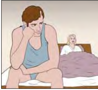
ผู้ป่วยบางรายไม่รู้สึกรอยอาการมีเพศสัมพันธ์เวลาได้รับการรักษาวัณโรค