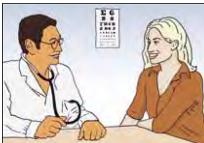
ผู้ป่วยเกือบทุกคนจะได้รับการติดตามดูแลจากแพทย์ หลังจากที่ยาจากโรคแล้ว

ปกติแล้ว แพทย์จะติดตามผลด้วยการตรวจสอบทางการแพทย์เป็นประจำหลังจากที่ท่านเข้ารับการรักษาจนเสร็จแล้ว บางทีอาจกินเวลานานถึงสองปีหลังจากที่ท่านหายจากโรค ร่างกายของท่านยังคงอ่อนแออยู่ ดังนั้นจึงเป็นเรื่องสำคัญที่แพทย์จะต้องติดตามดูอาการของท่านไปชั่วระยะหนึ่ง