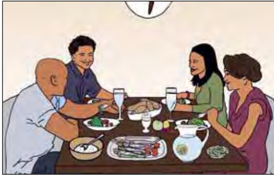
การทานอาหารร่วมกับผู้ป่วยวัณโรคเป็นเรื่องปลอดภัย

ปกติแล้วการทานอาหารร่วมกับคนอื่นเป็นวิธีการที่ดีในการเข้าสังคม ผู้ป่วยบางรายที่ไม่ค่อยอยากอาหารเคยบอกว่าเขาทานอาหารได้มากเวลาที่มีคนอื่นอยู่ด้วย การทานอาหารร่วมกับผู้ป่วยวัณโรคเป็นเรื่องที่ปลอดภัย – เราสามารถใช้จาน ส้อม และมีดร่วมกันได้ เชื้อวัณโรค (TB) ไม่สามารถติดต่อผ่านทางอาหารหรือการใช้ช้อน ส้อมร่วมกันได้ (ดูหน้า 6 เรื่องวิธีการติดต่อของเชื้อวัณโรค)