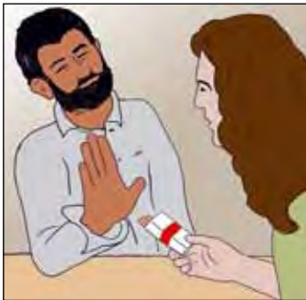
เป็นการดีที่สุดที่จะหลีกเลี่ยงการสูบบุหรี่เวลาที่เป็นวัณโรค

นอกจากนี้การสูบบุหรี่ทำให้คุณไม่ค่อยหิว ซึ่งจะทำให้ร่างกายคุณฟื้นตัวและต่อสู้กับวัณโรคได้ยากขึ้น ดังนั้น จึงเป็นการดีที่สุดที่จะหลีกเลี่ยงการสูบบุหรี่ โดยเฉพาะอย่างยิ่งเวลาที่คุณเป็นวัณโรคปอด