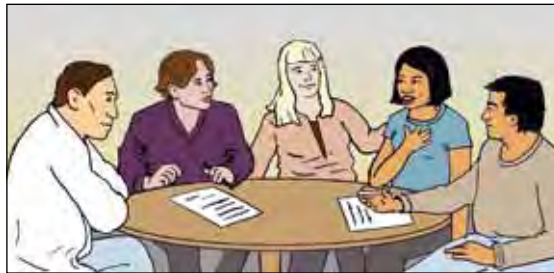
การประชุมแผนการรักษา

ผู้ประสานงาน TB ของคุณสามารถอธิบายรายละเอียดเกี่ยวกับแผนการรักษาและการประชุมนี้ได้