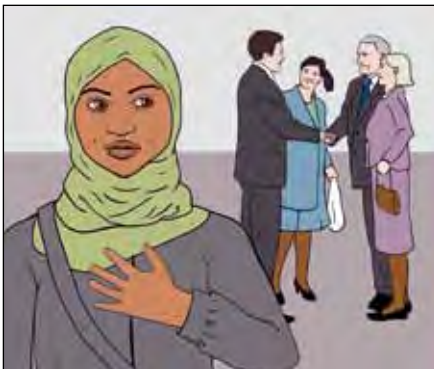
ผู้ป่วยบางคนรู้สึกโดดเดี่ยวในประเทศนอร์เวย์ โดยเฉพาะอย่างยิ่งในระยะแรกของการอาศัยอยู่ที่นี้

ผู้ป่วยวัณโรคส่วนใหญ่ในประเทศนอร์เวย์จะเป็นผู้ที่ย้ายถิ่นมาจากประเทศอื่น และหลายคนก็รู้สึกว่าสถานการณ์ของตนนั้นลำบากมากก็เพราะสาเหตุนี้ ผู้ป่วยย้ายถิ่นหลายคนไม่มีญาติพี่น้องอยู่ด้วยเลย; และอาจมีปัญหาด้านภาษา; หรืออาจไม่เคยชินกับอาหาร สภาพแวดล้อม และสังคมในประเทศนอร์เวย์