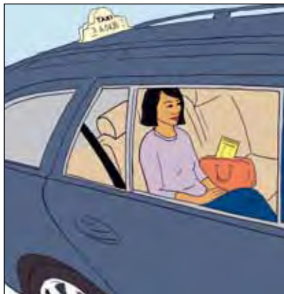
ผู้ที่ป่วยหนักเกินกว่าจะใช้การขนส่งสาธารณะ ก็สามารถนั่งแท็กซี่ได้

ท่านสามารถค้นหาจากเว็บไซต์ www.pasientreiser.no หรือ www.nav.no เพื่อดูรายละเอียดเกี่ยวกับระเบียบในพื้นที่ของท่าน หรือสอบถามจากผู้ประสานงาน TB เพื่อขอความช่วยเหลือในเรียกพาหนะสำหรับเดินทาง