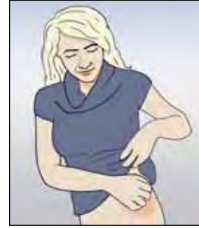
อาการคันและผื่น

ผู้ป่วยบางรายจะคันตัวมากและอาจมีผื่นขึ้น ซึ่งอาจสร้างความรำคาญได้อย่างมาก อาการคันนี้เกิดขึ้นจากอาการแพ้ยา หากอาการไม่รุนแรงนัก ท่านก็สามารถลดองปฏิบัติตามคำแนะนำด้านล่างได้ หากอาการคันและผื่นไม่ทุเลาลง ก็ให้ท่านปรึกษากับผู้ประสานงาน TB แพทย์ของท่านหรือพยาบาลบ้าน ในบางกรณีแพทย์สามารถสั่งยาแก้แพ้ได้ (ยากลุ่มแอนติฮิสตามีน) เพื่อบรรเทาอาการคัน