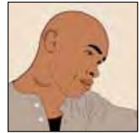
มีอาการบวมที่คอ ได้แชน หรือขาหนีบ

อาการเหล่านี้อาจจะเกิดจากโรคอื่นได้เช่นกัน ดังนั้น เพื่อให้แน่ใจว่าติดเชื้อวัณโรค (TB) จริง ท่านต้องเข้ารับการตรวจหลายอย่าง คนที่มีอาการข้างต้นอย่างใดอย่างหนึ่งหรือหลายอย่างควรพบแพทย์ทันที!