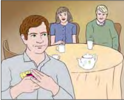
ผู้ป่วยบางคนกลัวที่จะคุยกับคนอื่นเกี่ยวกับโรคนี้

ผู้ป่วยวัณโรคหลายคนกลัวและหลบซ่อนโรคนี้จากผู้อื่น ปกติพวกเขาจะซ่อนโรคนี้ไว้เพราะพวกเขากลัวว่าเมื่อคนอื่นรู้ว่าตนเป็นวัณโรคแล้วจะหลบหน้า ไม่ยอมทานข้าวด้วย และอื่นๆ แม้ว่าผู้ป่วยจะต้องการบอกเพื่อนและคนอื่นๆ มากกว่าตนเองเป็นวัณโรค แต่ความกลัวนี้ก็ทำให้พวกเขาไม่กล้าที่จะเปิดเผยเรื่องโรคนี้ให้คนอื่นรู้