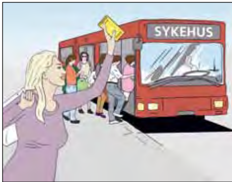
หากท่านแข็งแรงพอ ให้เลือกการขนส่งสาธารณะเพื่อไปยังสถานที่รักษา

ผู้ป่วยบางคนที่เดินทางบ่อยระหว่างรับการรักษา ค่าเดินทางทั้งหมดที่จำเป็นต่อการมารับการรักษาวันโรคนั้นฟรีไม่ต้องเสียค่าใช้จ่าย แต่ปกติแล้วผู้ป่วยมักจะต้องจ่ายค่าเดินทางเองก่อน แล้วค่อยรับเงินคืนที่หลัง ระเบียบหลักก็คือท่านต้องเดินทางด้วยทางเลือกการขนส่งที่ถูกลงที่สุด เช่นรถบัส รถไฟ หรือเรือ