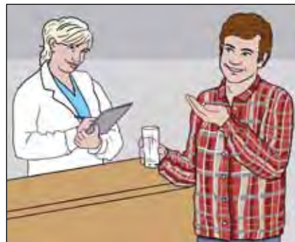
...แต่บางคนก็ชอบมารับยาอยู่ที่โรงพยาบาล