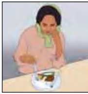
เบื่ออาหาร น้ำหนักลด