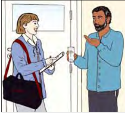
พนักงานสาธารณสุขจะส่งยาให้ที่บ้านผู้ป่วยทุกวัน

ผู้ป่วยทุกคนจะมีแผนการรักษาส่วนตัว ซึ่งจะกำหนดว่าจะพบพนักงานสาธารณสุขได้ที่ไหนและเมื่อไร เพื่อทานยา แผนการนี้สร้างขึ้นด้วยความร่วมมือระหว่างทั้งผู้ป่วยและพนักงานสาธารณสุข (ดูหน้า 20) มีผู้ป่วยหลายรายต้องการให้พนักงานสาธารณสุขมาที่บ้านของตน แต่ก็อาจนัดรับยาที่โรงพยาบาลหรือศูนย์สาธารณสุขของรัฐแห่งอื่นก็ได้