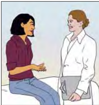
ปรึกษากับพนักงานสาธารณสุขที่ติดต่อกับท่าน หากท่านมีอาการจากผลข้างเคียงของยา

ท่านอาจจะมีวิธีการอื่นที่ตัวท่านหรือผู้ป่วย TB รายอื่นเคยลองใช้ กรุณาตรวจสอบกับแพทย์ TB ของท่านหรือพยาบาลบ้านเพื่อหารือว่าวิธีการดังกล่าวปลอดภัยหรือไม่ — แล้วบอกให้พวกเขาวิธีที่ดีที่สุดเพื่อแนะนำต่อแก่ผู้ป่วยรายอื่น ๆ ได้