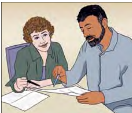
ท่านสามารถขอความช่วยเหลือจากพนักงานสังคมสงเคราะห์ได้หากมีข้อสงสัยด้านการเงิน

หน้า 47 จะมีรายละเอียดเกี่ยวกับสถานที่ต่างๆที่ท่านสามารถติดต่อเพื่อขอความช่วยเหลือได้