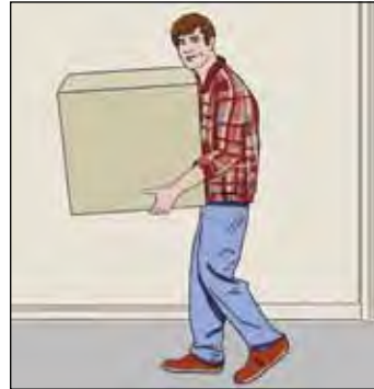
...แต่งานนี้อาจจะหนักเกินไป

ถ้าคุณมีงานประจำอยู่ คุณก็สามารถขอลาป่วย (sykmelding) ไปเรื่อยๆได้ตราบใดที่คุณยังป่วยเกินกว่าจะทำงานไหว ถ้าคุณรู้สึกแข็งแรงพอที่จะทำงานเล็กน้อย แต่ไม่ใช่งานเต็มเวลา คุณก็สามารถขอลาป่วยบางส่วน (gradert sykmelding) หรือลาป่วยเพื่อทำงานอื่น (aktiv sykmelding) ได้ ลองหารือกับผู้ประสานงานหรือแพทย์ TB ของคุณเกี่ยวกับเรื่องนี้