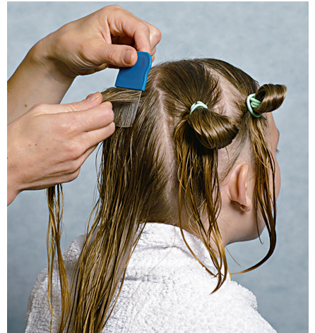
ኣብ ነዊሕ ጸጉሪ ዘለዉ ቍማል ንክትረኽቦም ነቲ ጸጉሪ ኣብ 3 ክሳብ 6 ክፋል መቐልካ ብብተራ ክትሰትንትሮ ኣለካ።