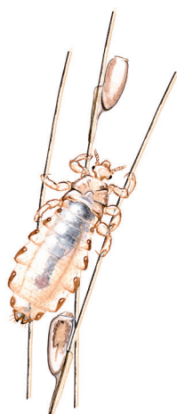
Dihkkemonit leat nannosit gitta vuoktačalmmiin.