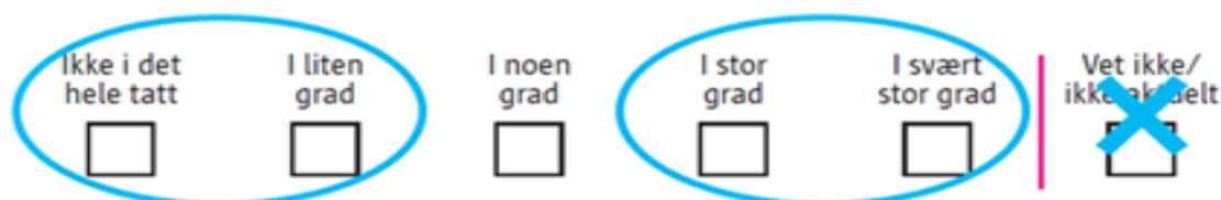
Figur 1: Svarskala på erfaringsspørsmål

Tabell 5 viser prosentvis svarfordeling i de opprinnelige svarkategoriene på øvrige pasienterfaringsspørsmål, bakgrunnsspørsmål og demografiske spørsmål i spørreskjemaet.