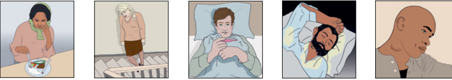
ምጥፋእ ሽውሃት ምጥዳል ጫዛን ሰብነት ስዓዒት ምልጽቕውን ድኻምን ንንውሕ ዚበለ ግዜ ዚጸንሕ ረሲኒ ሕበጥ ኣብ ክሳድ፣ ቱሽቱሽ ወይ ሽምጢ

ካልኦት ፍሉጣት ምልክታት ቲቢ - ናይ ሳንቡእ ቲብን ኣብ ካልእ ክፍሊ ኣካላት ዜጋጥም ቲብን - ድግ፡