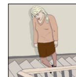
Pakiramdam ng panghihina at pagkapagod