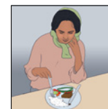
Walang ganang kumain Pagbawas ng timbang/ pangangayayat

Iba pang karaniwang palatandaan ng TB – kapwa ang TB sa baga at TB sa ibang bahagi ng katawan – ay: