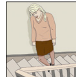
احساس ضعف و خستگی