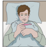
تب داشتن در یک مدت از زمان