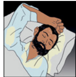
عرق کردن در هنگام شب