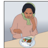
از دست دادن اشتها از دست دادن وزن

این علائم جزو نشانه های رایج بیماری های دیگر نیز هستند. بنابراین، برای آنکه مطمئن شوید که بیماری شما توبرکلوز است، باید آزمایش های مختلف بدهید. کسی که یک یا چند مورد از این نشانه ها را دارد باید به داکتر مراجعه کند!