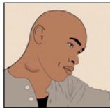
ورم کردن (پنیدگی) گردن، زیر بازوها، یا در کشاله ران

سایر نشانه های رایج توبرکلوز- هم در توبرکلوز شش و هم در توبرکلوز سایر قسمت های بدن عبارتند از: