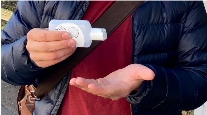
1. Rene hender