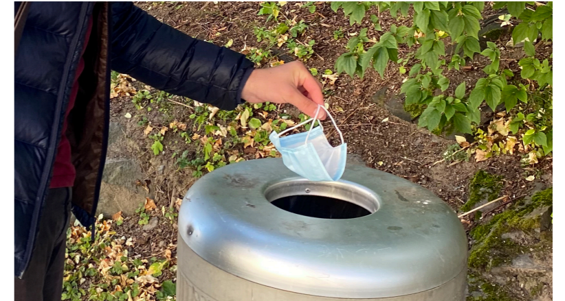
5. Kast i nærmeste søppelkasse