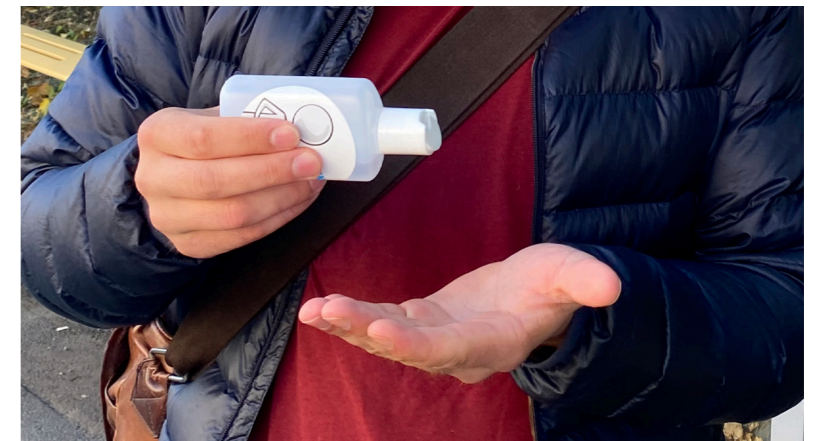
6. Rene hender