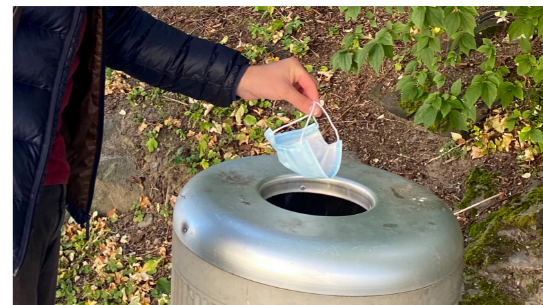
5. Kast i næraste søppelkasse