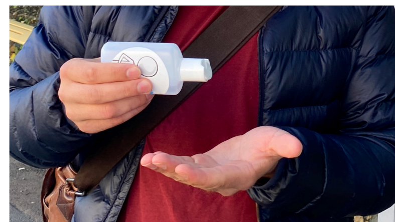
6. Reine hender