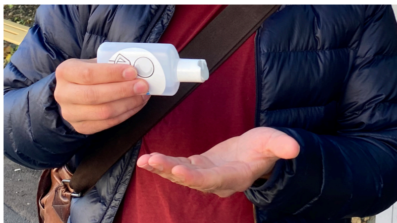
1. Reine hender