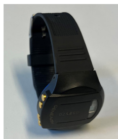
Aktivitets- og søvnmåler

Dere lurer kanskje på hvordan utstyret deltakerne skal bruke ser ut. Her er bilder av noe av utstyret: