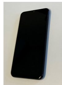
Mobiltelefon der en GPS-app er installert