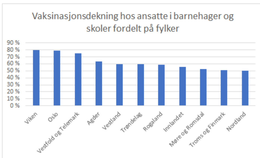
Figur 2. Andel vaksinerte per 12.07.21 blant ansatte i barnehager og skoler fordelt på fylke

Vaksinasjonstempoet vil variere mellom fylkene som et resultat av geografisk målrettet prioritering. Dette vil særlig gjelde for Oslo og Viken, som får en økt tildeling av vaksinedoser og kan dermed forvente å kunne tilby vaksiner til alle over 18 år mellom uke 29 og 30. Den målrettede geografiske prioriteringen avsluttes i uke 29.