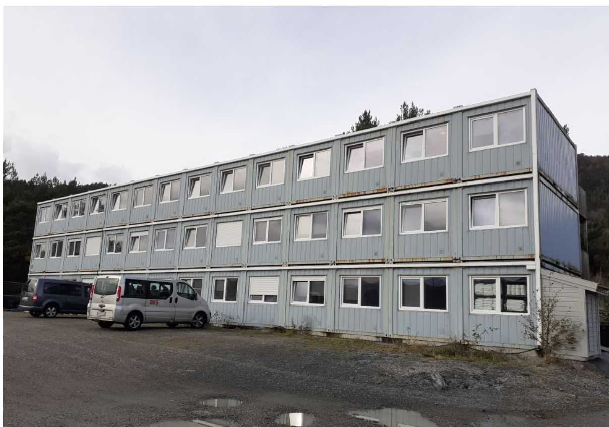
Brakkerigg Roligheten, ein av stadene kor gjestearbeidarar med påvist Covid-19 vart isolert ved Havyard Skipsverft, Hyllestad.

15.10.20. Revidert med komplett data 13.12.20