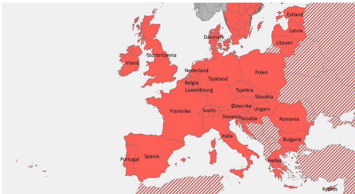
Figur 2: EU/EØS/Schengen-land vurdert på nasjonalt nivå etter foreslåtte kriterier for unntak av innreisekarantene, 28.september – 18. oktober, 2020. Regjeringens råd er å unngå alle ikke-nødvendige reiser til utlandet. Rød farge = høyt smittepress og karantene påkrevet ved innreise til Norge. Gul farge = økt risiko, karantene ikke påkrevet ved innreise til Norge. Rød farge skalert = ikke evaluert eller ikke tilstrekkelig data om smittepress, karantene påkrevet. Illustrasjon: Folkehelseinstituttet

Øvrige land i EU/EØS/Schengen er allerede røde og er ikke gjenstand for vurdering denne uken.