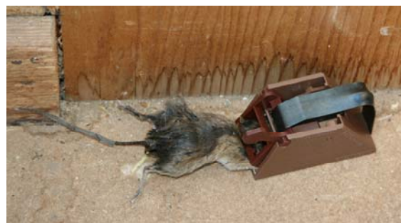
Figur 4. Skogmus tatt i klappfelle.

Klappfeller settes langs vegger, både på gulvet og gjerne oppe ved taket, der man har funnet ut at skogmusene ferdes. Fellene plasseres slik at utløsermekanismen vender inn mot veggen. Ofte vil det lønne seg å sette opp to feller ved siden av hverandre. Disse bør være ca 2-3 cm fra hverandre (se Figur 5). Eventuelt kan fellene plasseres to og to etter hverandre langs veggen med utløseren i ytterenden (se Figur 5). Det er ofte slik at jo flere feller man benytter jo bedre blir bekjempelsen. Husk at aksjonsradiusen til musene kan være svært begrenset (noen ganger bare noen meter fra bolet), og at fellene derfor må stå tett. Fellene bør ettersees så ofte som mulig.