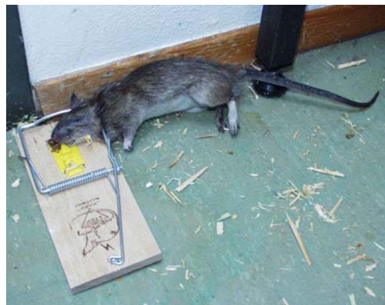
Figur 3. Brunrotte tatt i klappfelle. Klappfeller er også effektive mot stor skogmus.

Den beste fellen for privatpersoner er den velkjente klappfellen som effektivt dreper dyret når det forsøker å ta åten på fellen (se Figur 3, 4 og 5). Det finnes også levendefangende feller som kan fange flere mus samtidig. Generelt er alle mus enkle å fange i feller. Limfeller er ikke tillatt brukt.