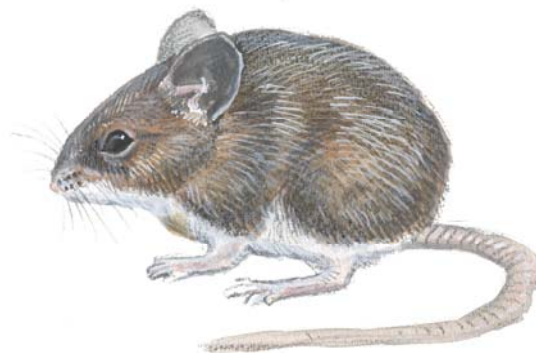
Figur 1. Stor skogmus er oftest brunrød på ryggen. Buken er hvit, og den har et gulbrunt halsbånd på brystet. Lengden på kroppen er 8-13 cm. Halen er oftest lenger enn kroppen. Illustrasjon: Trond Haugskott.

Man kan også bruke fotspor i støv (eventuelt talkum/mel som er strødd ut) for å bestemme hvilket dyr man har med å gjøre (se Figur 2). Stor skogmus har bare fire tær på frembeina, og fem tær på bakbeina. Fotavtrykket av bakfoten er om lag 22-24 mm langt. Som regel ser man slepespor av halen mellom fotavtrykkene.