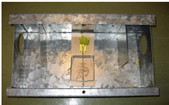
Figur 6. Plassering av klappfelle inne i åtestasjon av metall.