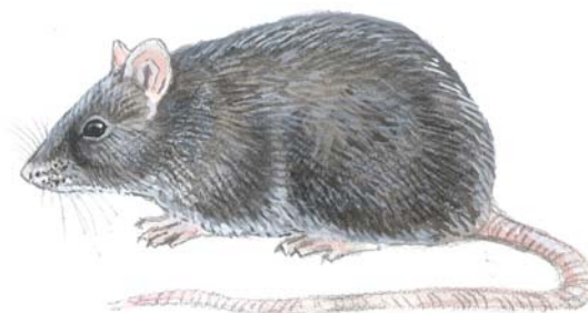
Figur 1. Svartrotta blir opptil 200 gram med en kroppslengde på 16-23 cm. Halen, som er lengre enn kroppen, er 18-25 cm lang. Pelsfargen kan variere fra grå til brun og svart. Illustrasjon: Trond Haugskott.

Ekskrementene fra svartrotter er opptil 1,2 cm lange, oftest svarte av farge, og mer buete enn de fra brunrotter. Ekskrementer fra andre dyr kan enkelte ganger forveksles med rottelort. Dette gjelder spesielt ekskrementer fra flaggermus og pinnsvin. Flaggermuslort er betydelig mindre og inneholder bare insektrester, og den smuldrer lett opp om man tar på den. Ekskrementer fra pinnsvin er normalt mye større enn de fra rotter, og de inneholder bare insektrester, litt plante-materiale og ofte sandkorn.