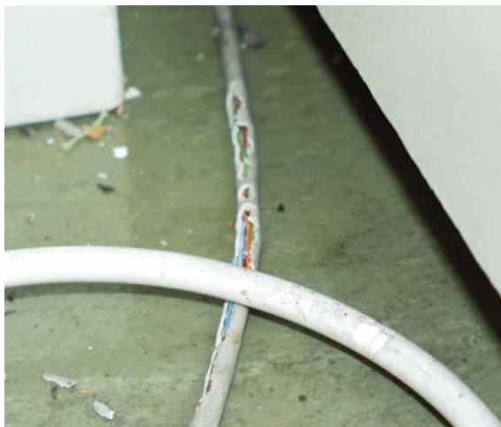
Figur 2. Rottetnag på strømledninger øker faren for kortslutning og brann.

Man ser ofte skader i isolasjonsmaterialer inne i bygninger der det er svartrotter. Videre kan de gjøre stor skade på møbler, klær, gardiner, bøker, malerier og lignende. Det er heller ikke ukjent at de kan gnage på vannledninger, og på den måten medføre vannskader. Noe av det alvorligste er at rotter ofte gnager på strømledninger (se Figur 2), noe som kan øke risikoen for kortslutning og brann. Datakabler og telefonledninger kan også være spesielt utsatt. Dyr som dør inne i vegger og gulv kan forårsake et betydelig luktproblem.