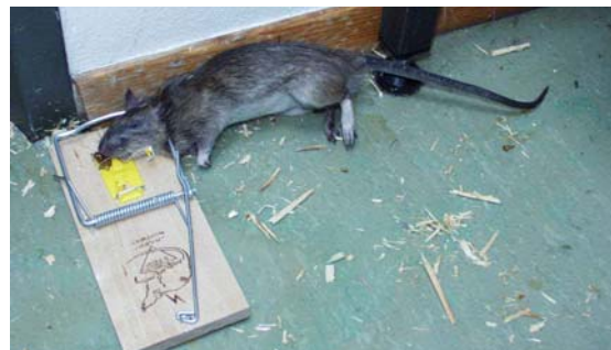
Figur 3. Brunrotte tatt i klappfelle.

Det er viktig å huske på at rotter lever i et tredimensjonalt rom, og at feller også må plasseres høyt oppe og ikke bare nede ved gulvet. Dette gjelder spesielt for svartrotter som klatrer mye, og tilbringer mesteparten av tiden høyt oppe i bygninger. Den beste fellen for privatpersoner er den velkjente klappfellen som effektivt dreper dyret når det forsøker å ta åten på fellen (se Figur 3). Det finnes også levendefangende feller som kan fange flere dyr samtidig. Det kan imidlertid være vanskelig å fange svartrotter i feller fordi de ofte er så redde for nye ting i omgivelsene. Det er derfor viktig at man er tålmodig og lar dyrene bli vant til fellene. Limfeller er ikke tillatt brukt.