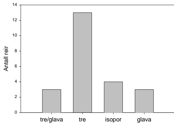
Figur 1. Type reirmateriale brukt av storkmauren. To av reirene var i samme hus.

I 60% av husene var ytterveggene, medregnet vinduskarmer og bunnsviller, angrepet (Figur 2). Deretter kom gulv (31%) og tak (18%). Seks av ytterveggene vendte mot øst, seks mot vest eller sørvest og en mot nord. At veggene er den mest utsatte konstruksjonen samsvarer med eldre undersøkelser fra både USA og Sverige (1, 2).