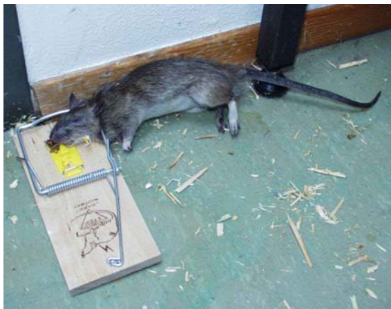
Figur 3. Brunrotte tatt i klappfelle. Det er ofte lettere å fange mus i slike feller enn rotter.

(se Figur 4). Det er ofte slik at jo flere feller man benytter jo bedre blir bekjempelsen. Husk at aksjonsradiusen til mus kan være svært begrenset (noen ganger bare noen meter fra bolet), og at fellene derfor må stå tett. Fellene bør ettersees så ofte som mulig.