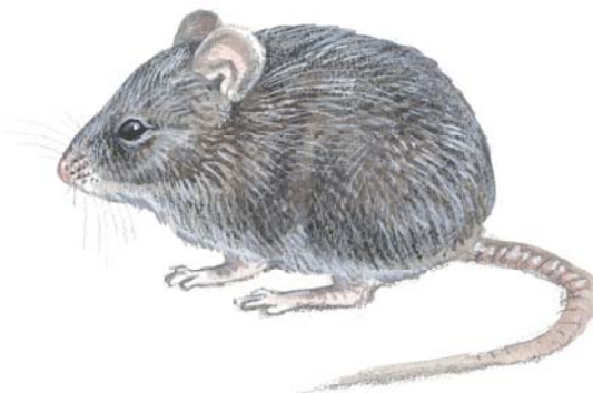
Figur 1. Husmus er oftest grålig (ofte med litt innslag av brunt) på ryggen, mens buken er lysere. Lengden på kroppen er 6-10 cm. Halen er oftest like lang som kroppen. Føttene er brungrå med hvite tåspisser. Illustrasjon: Trond Haugskott

Man kan også bruke fotspor i støv (eventuelt talkum/mel som er strødd ut) for å bestemme hvilket dyr man har med å gjøre (se Figur 2). Husmus har, som de andre gnagerne, bare fire tær på frembeina, og fem tær på bakbeina. Fotavtrykket av bakfoten er om lag 12-14 mm langt. Som regel ser man slepespor av halen mellom fotavtrykkene.