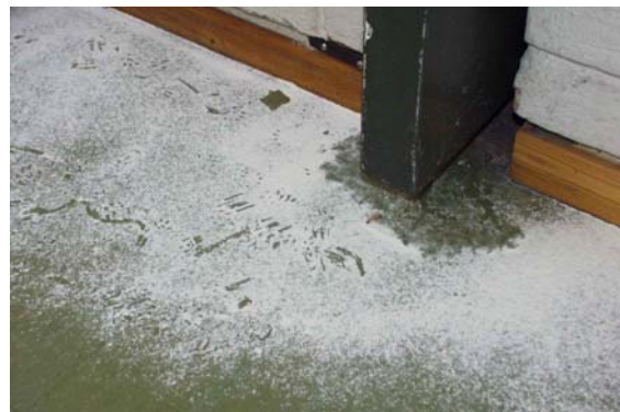
Figur 2. Spor etter brunrotte i mel. Mel og talkum kan strøs ut for å se fotspor av dyrene. Dermed kan man se om man har rotter eller mus i huset, samt at man kan finne vandringsveier.

Husmus viser liten grad av neofobi (frykt for ny ukjent mat, nye gjenstander og fremmede lukter i miljøet sitt). Derimot er mus generelt nysgjerrige, og derfor mye lettere å bekjempe enn rotter. Alle gnagere kan utvise noe som kalles åtevegning. Et dyr som ikke vil spise mat/åte i det hele tatt utviser primær åtevegning. Et dyr som har blitt syk av mat den har spist vil senere kunne unngå akkurat slik mat. Dette fenomenet kalles sekundær åtevegning.